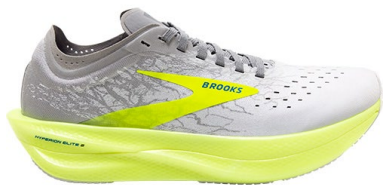
Brooks Hyperion Elite