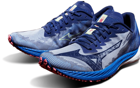
Wave Duel 3