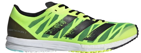
Adizero Takumi Sen 5 Adizero Takumi Sen 6 Adizero Takumi Sen 7