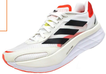
Adizero Boston 10