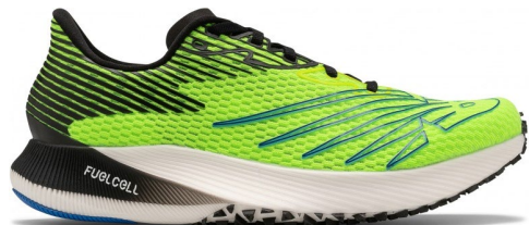
FuelCell RC Elite