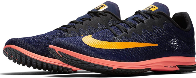
Zoom Streak LT