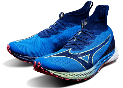
Wave Duel NEO 2 Elite