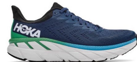
HokaONEone Clifton 7