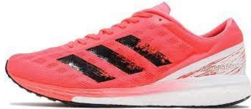
Adizero Boston 9