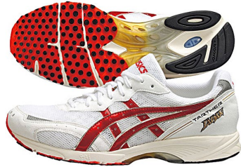
Tather Japan (ターサーシリーズ全般NG)