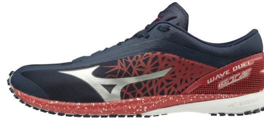
Wave Duel Gtz