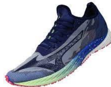
Wave Duel NEO2