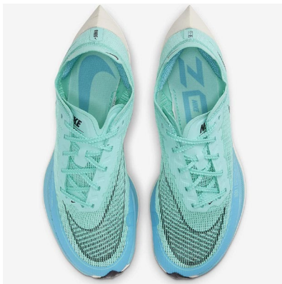
ZoomX Vaporfly Next%