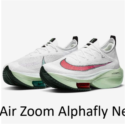
Air Zoom Alphafly Next %