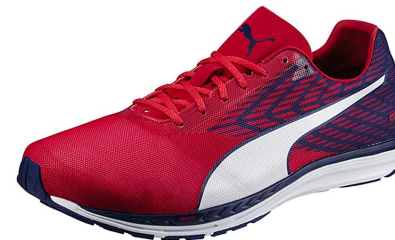
Puma Speed 100 R Ignite