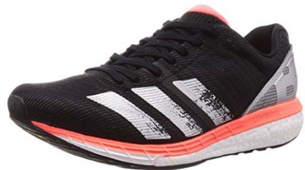
Adizero Boston 8