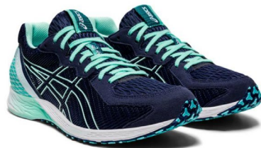
Tatheredge2(ターサーシリーズ)

Skysensor Japan、Tatherzeal6、Evoride、Lyteracer2など