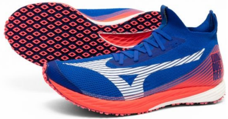
Wave Duel NEO