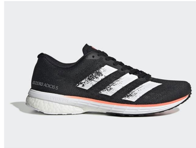
Adizero Adios 5