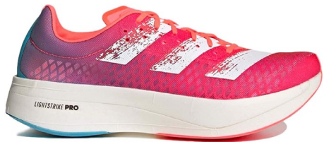
Adizero Adios Pro