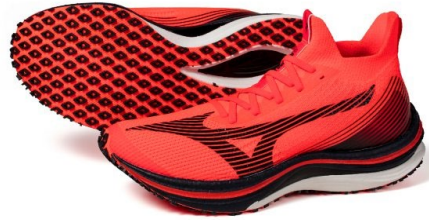
Wave Duel NEO Sp