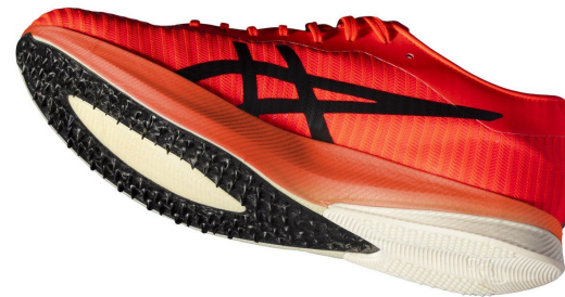
METASPEED LD 0