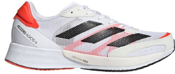
Adizero Adios 6