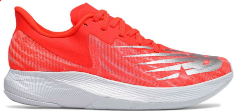
FuelCell Racer TC