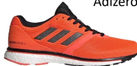
Adizero Adios 4